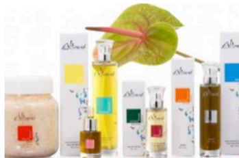
Gamme de cosmétiques bio de la marque Altearah Bio.